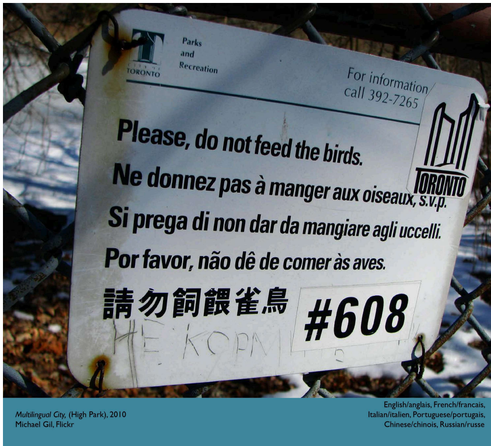
Multilingual City, (High Park), 2010

English/anglais, French/français, Italian/italien, Portuguese/portugais, Chinese/chinois, Russian/russe